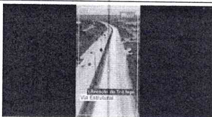
Foto 2 – Cobertura do evento de liberação da Via Estrutural em 12/12/2023