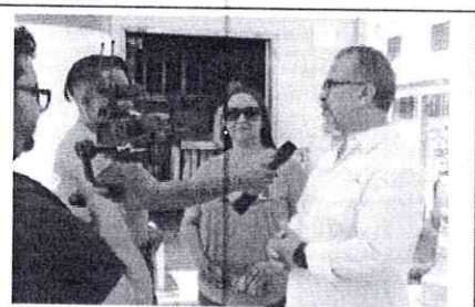
Foto 1 – Cobertura e Divulgação do Lançamento do Programa Mão na Massa na Cidade Estrutural, em 03/04/2023

Handwritten signatures in blue ink, including a large signature at the bottom and smaller ones above it.