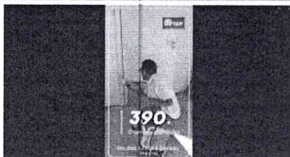
Foto 1 – Divulgação do andamento das obras de construção do CEPI da Cidade Estrutural em 17/10/2023