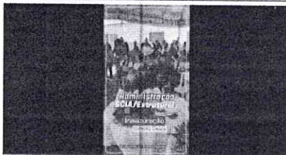
Foto 1 – Cobertura do evento de inauguração do espaço Direito Delas da Secretaria de Justiça e Cidadania, em 08/12/2023