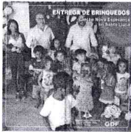
Foto 1 – Divulgação da entrega de brinquedos no Santa Luzia Em 16/11/2023