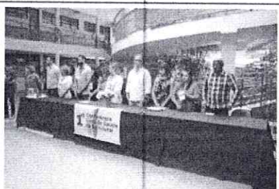
Foto 2 – Administração presente na 1ª Conferência Livre de Saúde da Estrutural em 25/02/2023

Entre as realizações extraordinárias destacam-se a 1ª Conferência Livre de Saúde da Estrutural, o Lançamento do Programa Banheiro Social na Cidade Estrutural, Lançamento do Programa Mão na Massa na Cidade Estrutural, o chamamento para o FAC Brasília, ações de remoção de ocupantes de rua, mutirão de desobstrução de bueiros com hidrojato, reforma do campo sintético, reunião na Secretaria de Saúde com a pauta da construção de unidades de saúde na Estrutural, campanha "Cuidados com Escorpião", a ação de entrega de cestas básicas para famílias carentes na cidade Estrutural, oferecidas pela Secretaria de Desenvolvimento Social, andamento das obras de construção do CEPI, entrega de brinquedos no Santa Luzia, inauguração do espaço "Direito Delas" da Secretaria de Justiça e Cidadania, Cobertura do evento de liberação da Via Estrutural.