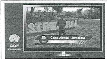
Foto 2 - Divulgação de ações de remoção de ocupantes de rua, bem como ações de manutenção nas principais avenidas da cidade