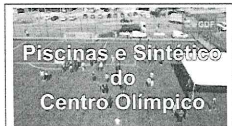
Foto 1 - Divulgação da inauguração do campo de grama sintética na Cidade Estrutural em 20/08/2023