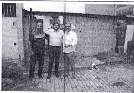
Foto 1 – Cobertura e Divulgação do Lançamento do Programa Banheiro Social na Cidade Estrutural, em 01/03/2023