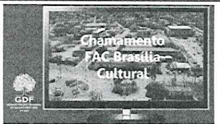
Foto 2 - Divulgação do chamamento para o FAC Brasília em 25/04/2023