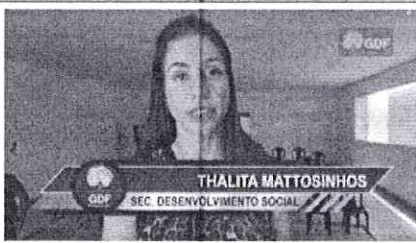
Foto 2 – Divulgação da ação de entrega de cestas básicas para famílias carentes na cidade Estrutural, oferecidas pela Secretaria de Desenvolvimento Social em 27/09/2023