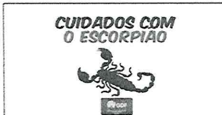
Foto 2 - Divulgação da campanha "Cuidados com Escorpião" em 04/08/2023

Handwritten signatures in blue ink, including the name 'Rafael' and another illegible signature.